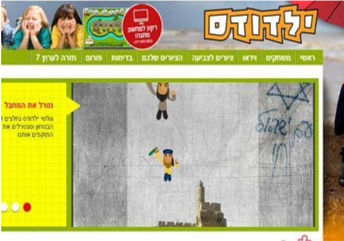
صورة للعبة الحاسوب التي عرضتها القناة السابعة الإسرائيلية تحت اسم "اضرب المخرب"

وقد طالبت "ميزان" في رسالتها من المستشار القضائي للحكومة والقائم بأعمال مفتش عام الشرطة بحذف اللعبة وإزالتها من الموقع وفتح تحقيق ضد القائمين على هذا الموضوع. وأن هدف اللعبة هو التحريض والتشجيع على قتل الأشخاص وزرع الكراهية والعداوة تجاه الآخرين، وذلك حسب قانون التحريض للعنف والإرهاب والتحريض للعنصرية. حيث عقب أحد اللاعبين على اللعبة بالقول: "حقيقة هذه متعة، ونأمل أن كل من قتل في اللعبة الافتراضية أن يقتل في الحقيقة".