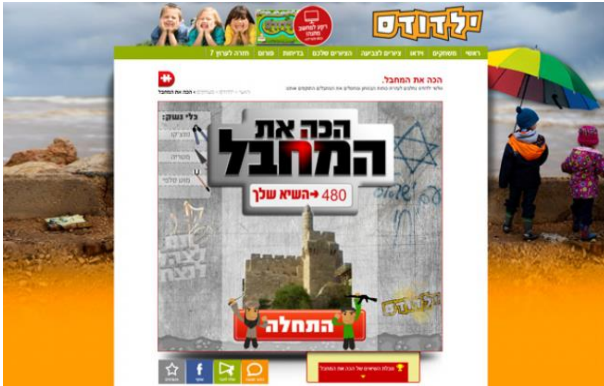
صورة للعبة الحاسوب التي عرضتها القناة السابعة الإسرائيلية تحت اسم "اضرب المخرب"

وتعرض لعبة الحاسوب المذكورة للأولاد أخذ عصا أو مظلة ويتم قتل "المخربين" على حد تعبير الموقع، والذين يظهرون على شكل رسومات كاريكاتورية عنصرية للعرب. كما ظهرت نفس اللعبة على صفحة الفيس بوك لهذه المواقع.