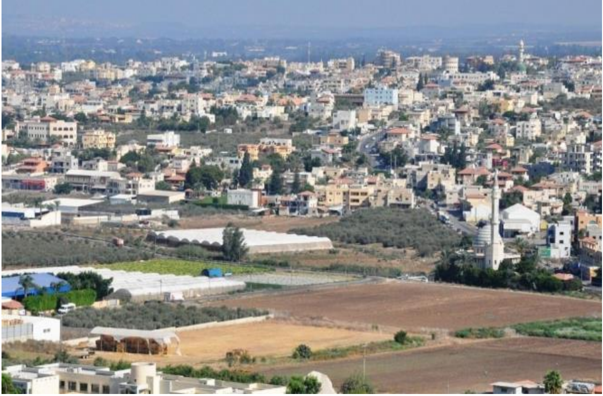
صورة لمدينة باقة الغربية

تابعت مؤسسة ميزان لحقوق الإنسان (الناصرية)، ملف قضية التصريحات العنصرية لرئيس اللجنة المعنية في باقة الغربية/جت التي أثارَت السخط والغضب لدى الأهالي لما فيها من مسّ بالمشاعر الدينية والمخالفات في قانون الجنايات.