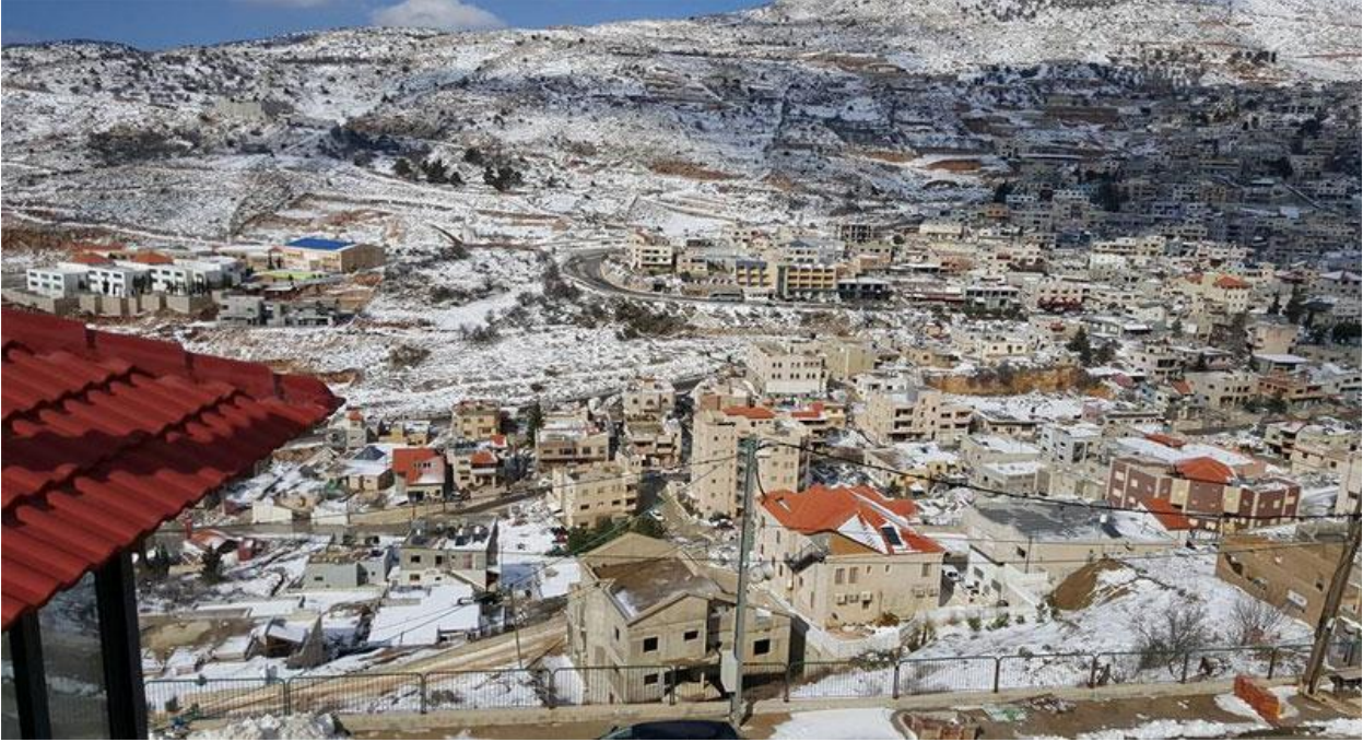
صورة لبلدة مجدل شمس

تقع "مجدل شمس" على السفح الجنوبي لجبل الشيخ (حرمون) بإقليم البلان في هضبة الجولان السورية، عند مثلث الحدود بين سوريا ولبنان وفلسطين. وتعد كبرى قرى الجولان الخمس المحتلة، وهي إضافة إلى مجدل شمس: بقعاثا وعين قنية والعجر ومسعدة. وهي قرية سورية أغلبية سكانها من الطائفة الدرزية، وتعد كبرى قرى إقليم البلان في الجولان السوري الذي تحتله إسرائيل منذ حرب النكسة عام 1967. اشتهر أهلها بمقاومة جهود الاحتلال لتطويعهم سياسيا وثقافيا.