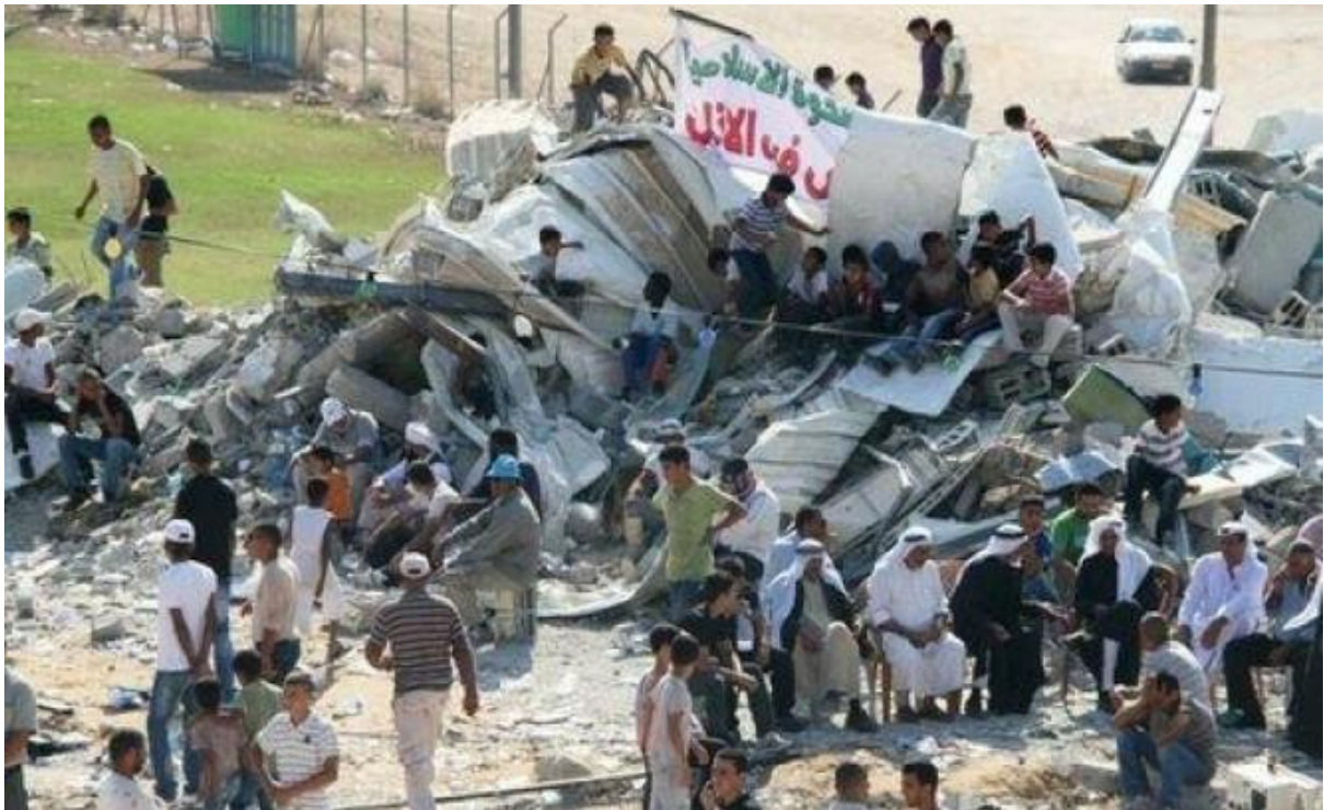
تجمع الناس أمام المسجد المهدم- رهط