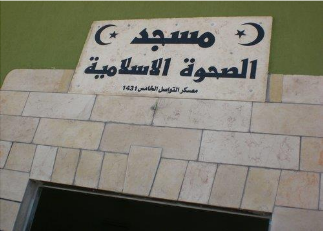
مسجد الصحوة الإسلامية في مدينة رهط بعد الانتهاء من بنائه عام 2010