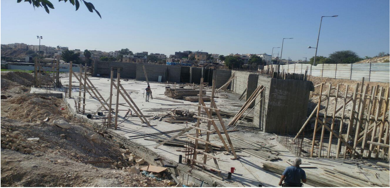
المباشرة من جديد في بناء مسجد الصحوة في رهط (2017)

وفي 2017/11/15، قضت محكمة الصلح في مدينة بئر السبع، بتغريم لجنة مسجد الصحوة في مدينة رهط، والمكونة من 8 أشخاص، بدفع 130 ألف شيقل، تغطية لتكاليف هدم المسجد عام 2010 من قبل الأذرع الإسرائيلية. وبعد متابعة قضائية متواصلة لمؤسسة ميزان لحقوق الإنسان في الناصرة، بوشرت من جديد الأعمال في بناء مسجد الصحوة، بعد استصدار المصادقات اللازمة، ويضم الصرح العتيد مجمعا إسلاميا يشتمل على مسجد وقاعة.