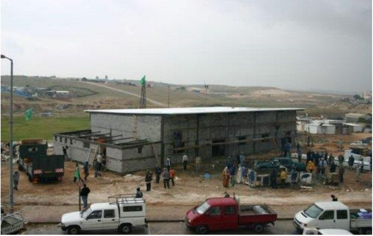
بناء مسجد الصحوة الإسلامية في مدينة رهط خلال معسكر التواصل مع النقب الخامس عام 2010