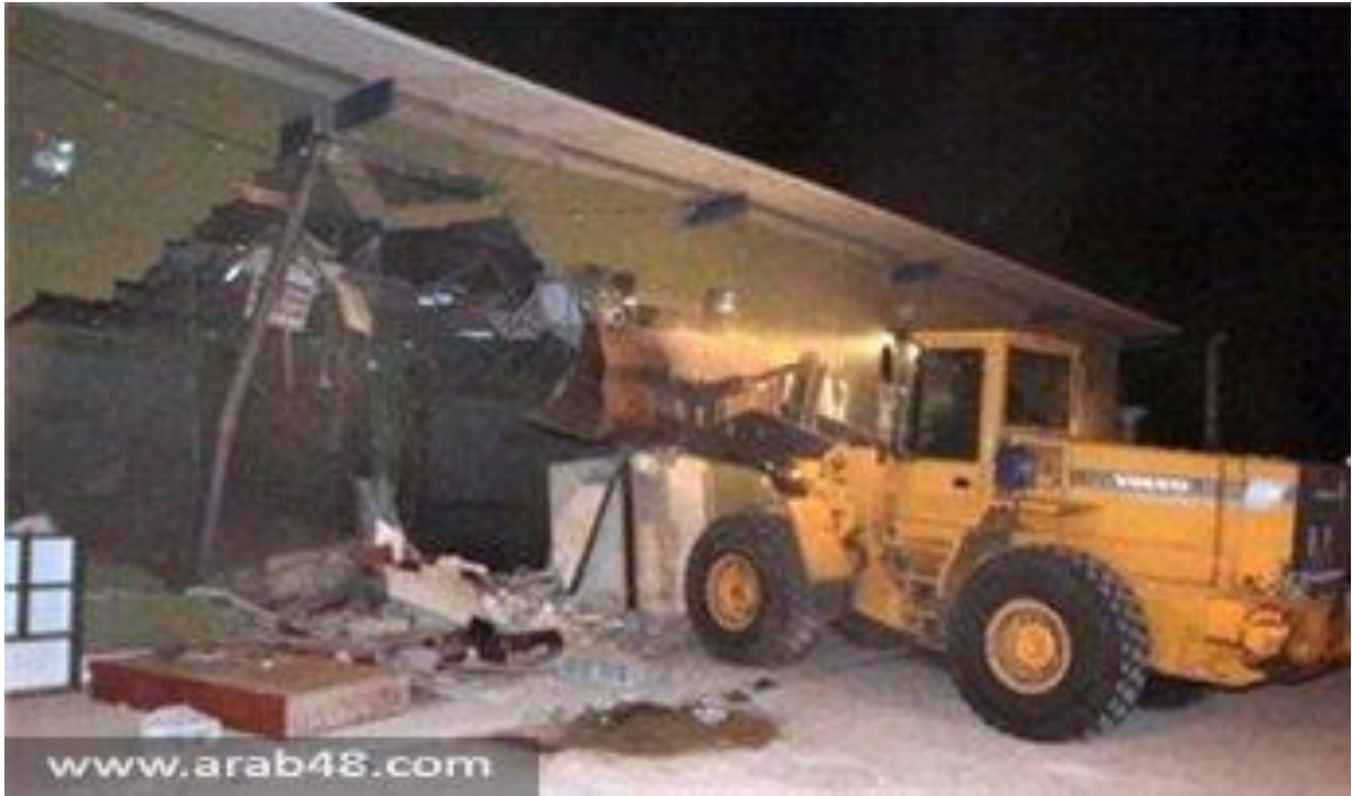
هدم مسجد الصحوة في رهط فجر 2010/11/7