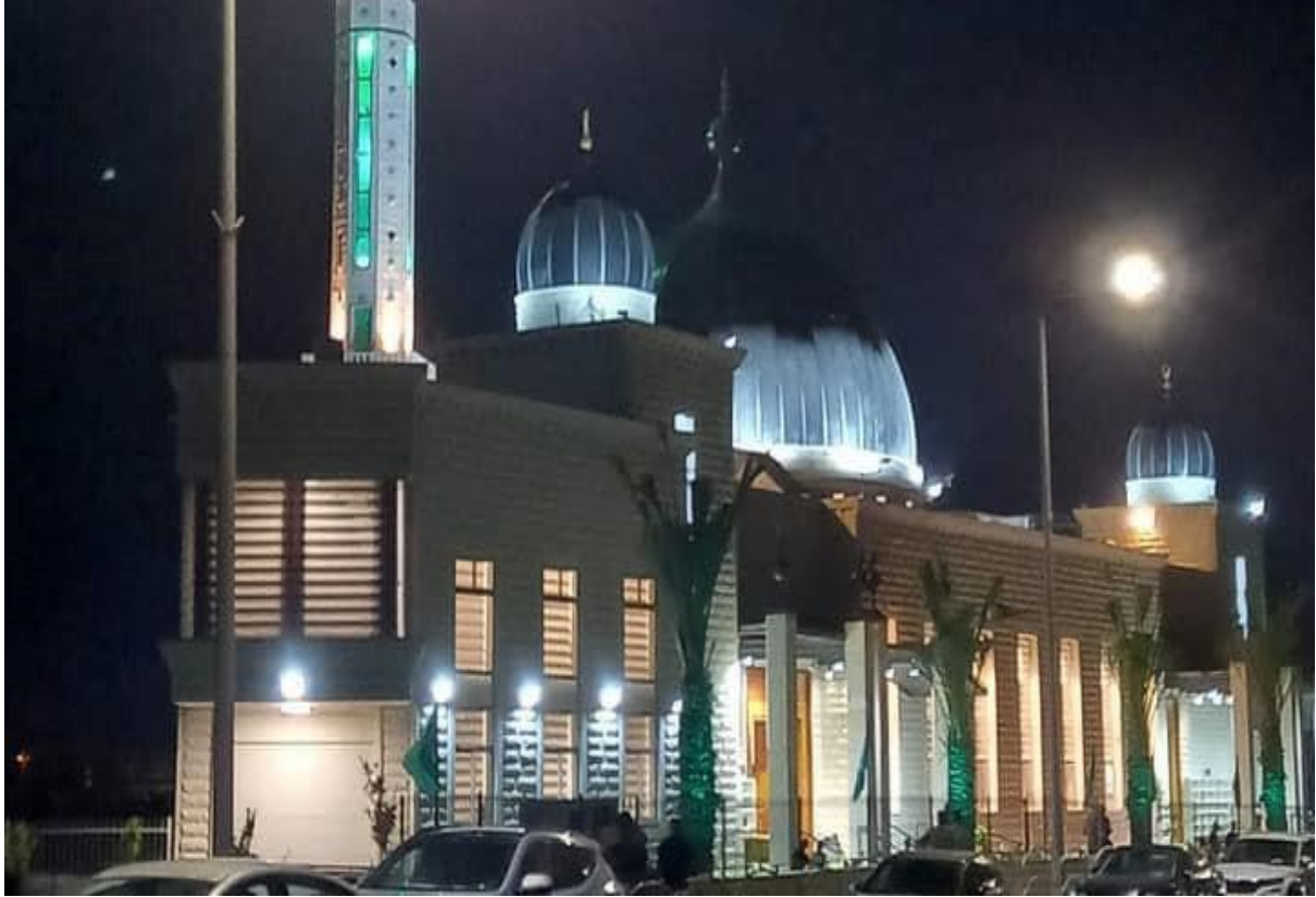
افتتاح مسجد الصحوة في مدينة رهط بالنقب (2022/7/23)

وفي 2022/7/23، تم افتتاح مسجد الصحوة في مدينة رهط بالنقب، بمشاركة كبيرة من أهالي والضيوف. وقد استغرقت مراحل البناء خمس سنوات، رغم ما تعرض له المسجد من عملية هدم في المرحلة الأولى من بنائه عام 2010 على يد السلطات الإسرائيلية، ثم نجاح لجنة المسجد وبمتابعة من مؤسسة ميزان لحقوق الإنسان في الناصرة عبر طواقمها في انتزاع التراخيص اللازمة لاستئناف البناء.