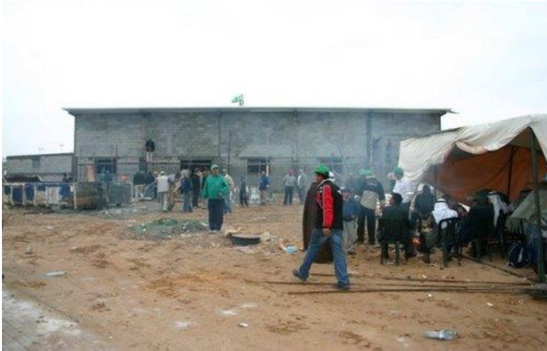
بناء مسجد الصحوه الإسلامية خلال معسكر التواصل مع النقب الخامس عام 2010