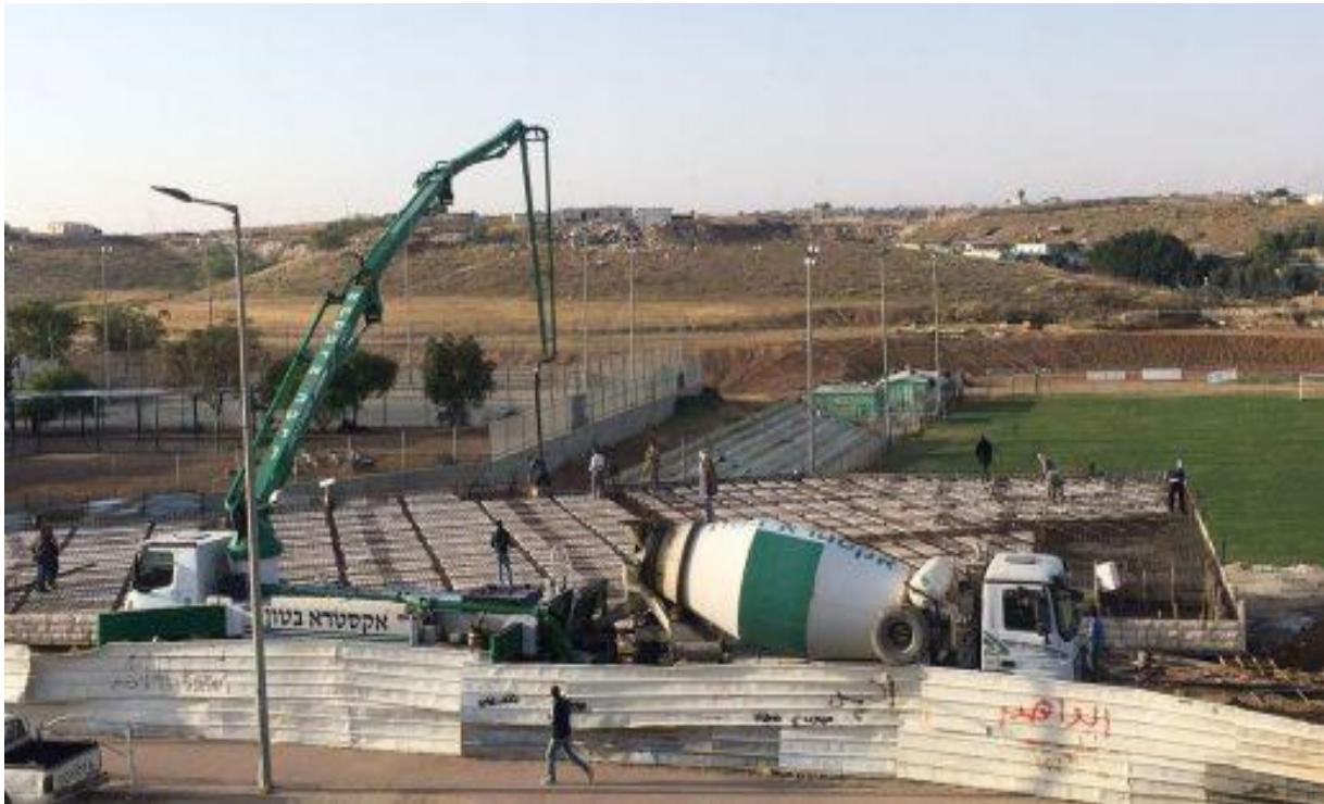
أثناء مرحلة بناء مسجد الصحوة الإسلامية في رهط