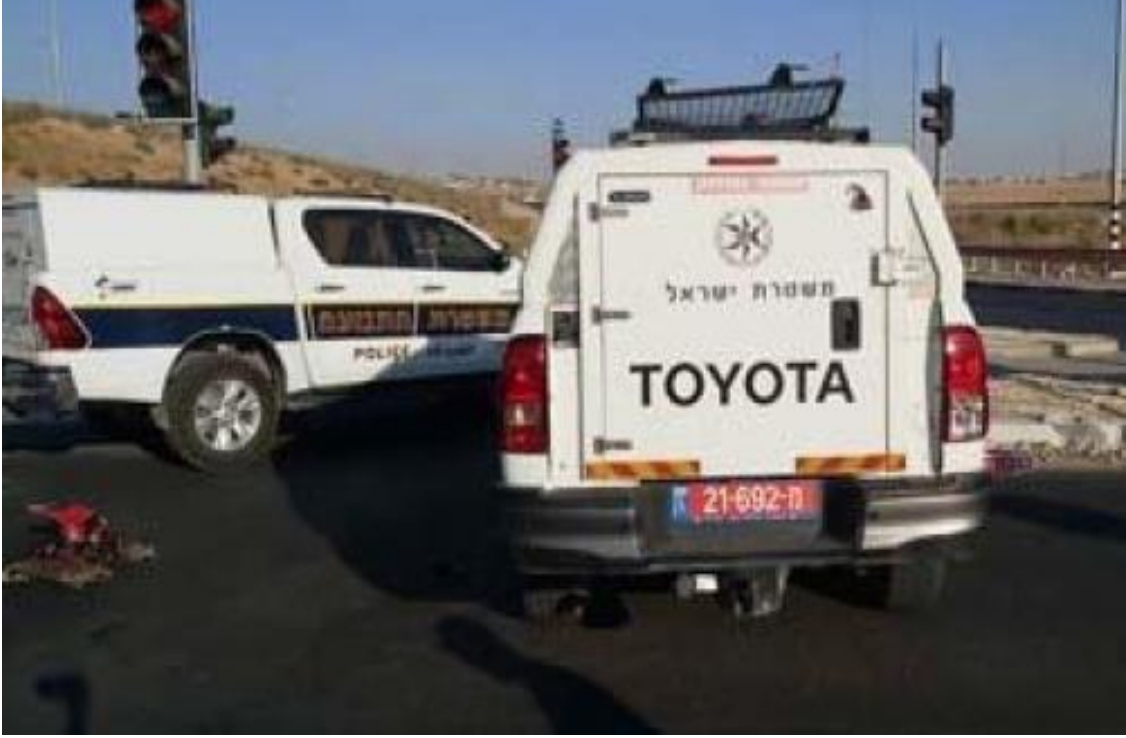
من مكان الحادث بالنقب

وقالت عائلة أبو كف، وفق شهادتها، إنّ الشرطة دهست ابنها ما أسفر عن وفاته. وأكّدت أنها ستقدم شكوى إلى قسم التحقيقات مع أفراد الشرطة الإسرائيلية (مباحش).