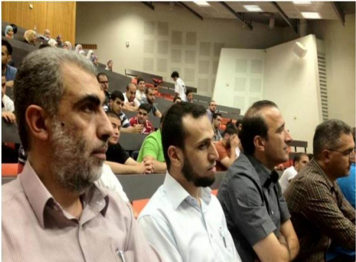
الشيخ كمال خطيب يقدم محاضرة للطلاب الجامعيين في جامعة القدس بعد تدخّل "ميزان" وتقديمها الالتماس

وأكدت "ميزان" في التماسها أن طلبها بإلغاء قرار الجامعة جاء لما فيه من انتهاك صارخ للحق في التعبير عن الرأي والحق في المعرفة والمساس في قانون أساس احترام الإنسان وكرامته وأن من حق الطلاب العرب الاستماع لقياداتهم وإن كانت آراءهم غير مقبولة لدى هيئات الجامعة أو الأوساط اليهودية المختلفة. وحذرت مؤسسة ميزان من خطورة السياسات الأخيرة التي تنتهجها الجامعات الإسرائيلية بضغوط من اليمين المتطرف كأعضاء كنيست وكتلة "إم تريتسو" الطلابية من منع قيادات الجماهير العربية الدخول لحرمة وإلقاء محاضرات للطلاب الجامعيين العرب، حيث منعت في أوقات سابقة جامعة حيفا دخول الشيخ رائد صلاح والشيخ كمال الخطيب من دخولها لإلقاء محاضرات للطلاب العرب.