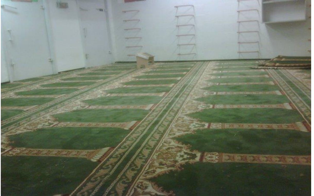
افتتاح مصلى في جامعة القدس العبرية

بدعم وبتغطية ومرافقة قانونية وتوجيه من مؤسسة ميزان لحقوق الإنسان في الناصرة، افتتحت لجنة اقرأ للعمل الطلابي في جامعة القدس العبرية، مصلى للطلاب المسلمين في الجامعة. وقد بدأت مسيرة المطالبة بالمصلى في العام 2011 حين قام كادر اقرأ بتجميع قرابة ألف توقيع وقدم طلباً رسمياً لإدارة الجامعة لإقامة مصلى يخدم الطلاب المسلمين، وافقت الجامعة على اقامة مصلى في حرم عين كارم، افتتحت كتلة اقرأ وفرشته بالسجاد ليتوافد ويصلي فيه عشرات الطلاب، العاملين والزوار يومياً.