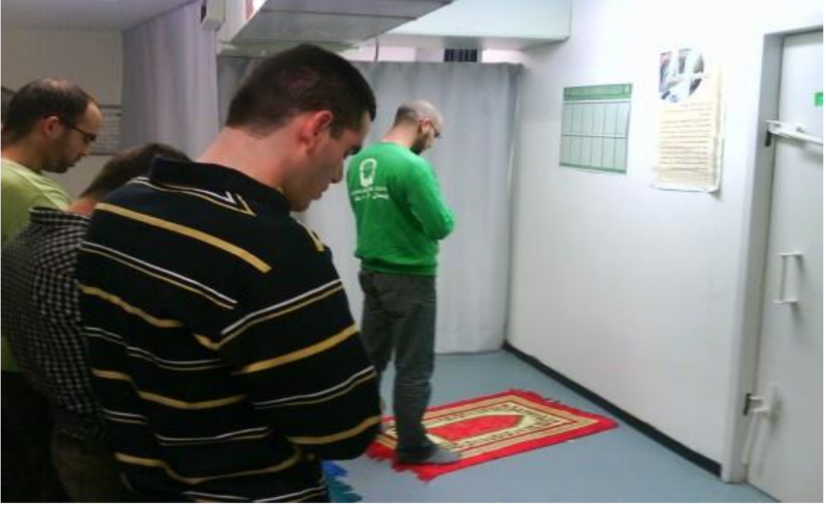
افتتاح مصلى في جامعة القدس العبرية

2012/5/31: بعد تدخل "ميزان": الجامعة العبرية تتراجع عن منع الشيخ كمال الخطيب من القاء محاضرة أمام الطلاب