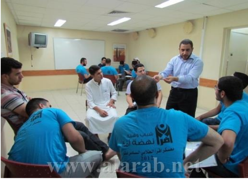
محامو مؤسسة "ميزان" لحقوق الإنسان في ورشات عمل في معسكر اقرأ حول الخدمة المدنية