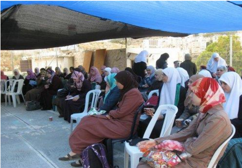
جانب من حضور الطالبات الجامعيات في معسكر اقرأ