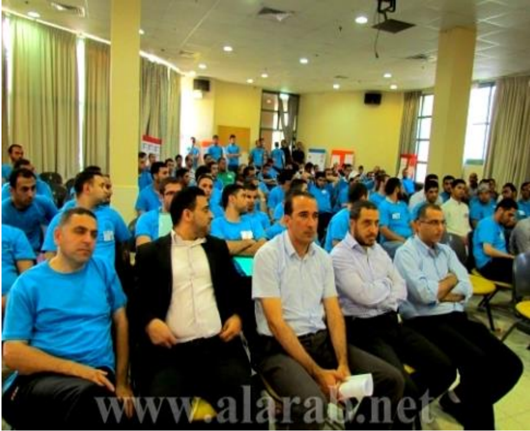
محامو مؤسسة "ميزان" لحقوق الإنسان في ورشات عمل في معسكر اقرأ حول الخدمة المدنية