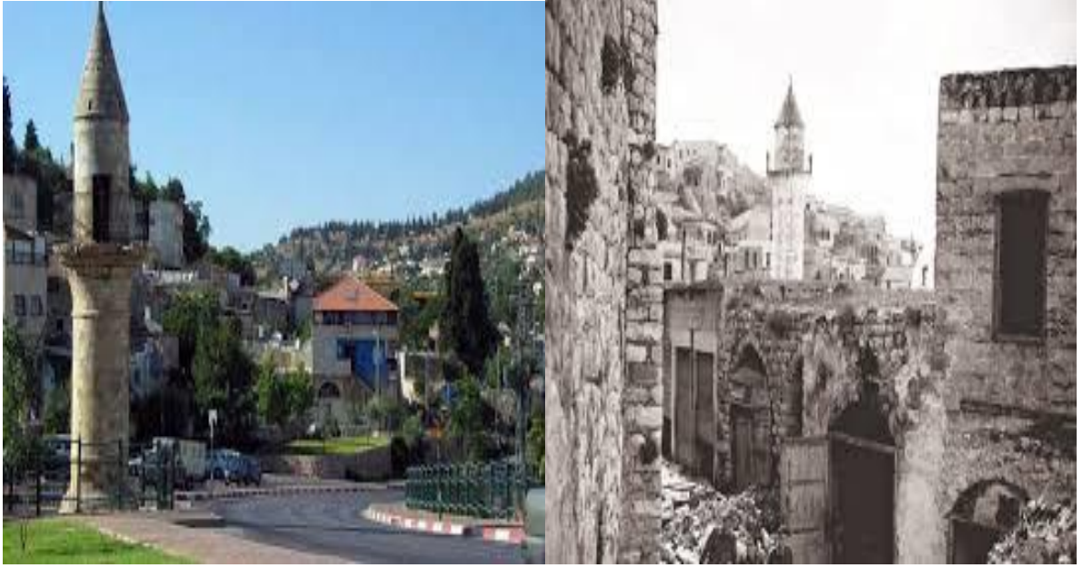
منذنة مسجد الشيخ عيسى في صفد قبل أثناء النكبة وبعدها وتبدو يتيمة في المنطقة