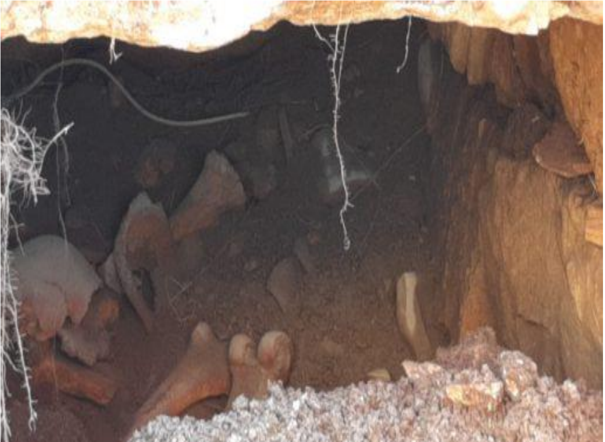
رفات وعظام الأموات في مقبرة صفد بعد عملية الحفر