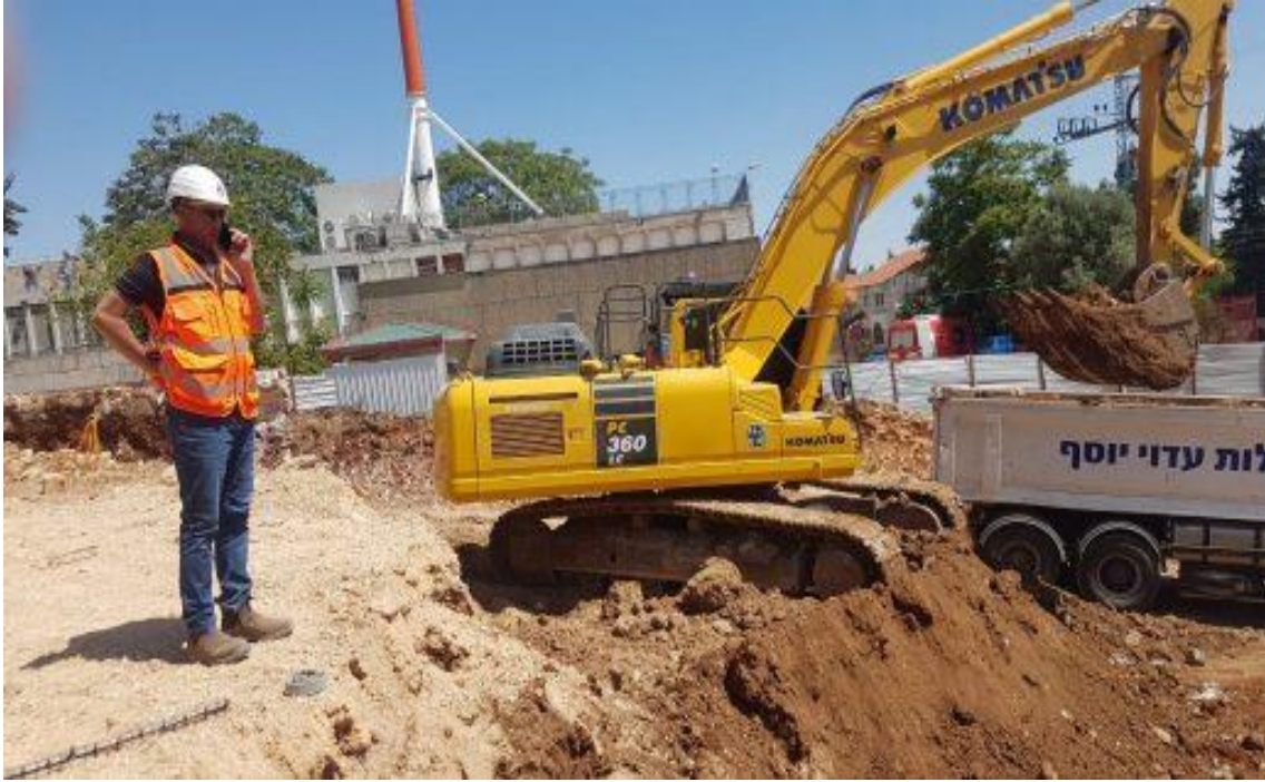
أعمال حفر في المقبرة الإسلامية في صفد

وتوثق الصور انتهاكات واضحة للمقبرة وتدنيس لحرمة الأموات ونقل رفاتهم وعظامهم.