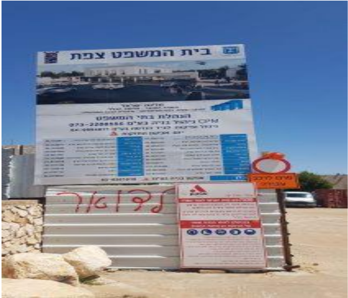
صورة لمخطط مشروع المبنى الجديد للمحكمة على أرض المقبرة الإسلامية في مدينة صفد