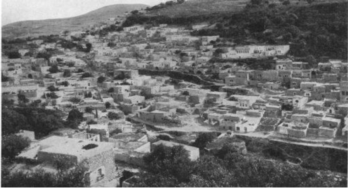
مدينة صفد قبل نكبة عام 1948

تعرضت مقبرة صفد الإسلامية لانتهاكات واضحة وتدنيس لحرمة الأموات ونقل رفاتهم وعظامهم من أجل بناء محكمة إسرائيلية على أرض المقبرة، ما حدى بمؤسسة ميزان لحقوق الإنسان في الناصرة لتقديم التماسا إلى المحكمة للمطالبة الفورية بوقف أعمال الجرف والتدنيس في المقبرة.