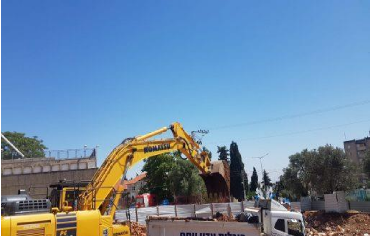
أعمال حفر في المقبرة الإسلامية في صفد

(صور إضافية من أعمال الحفر في مقبرة صفد الإسلامية)