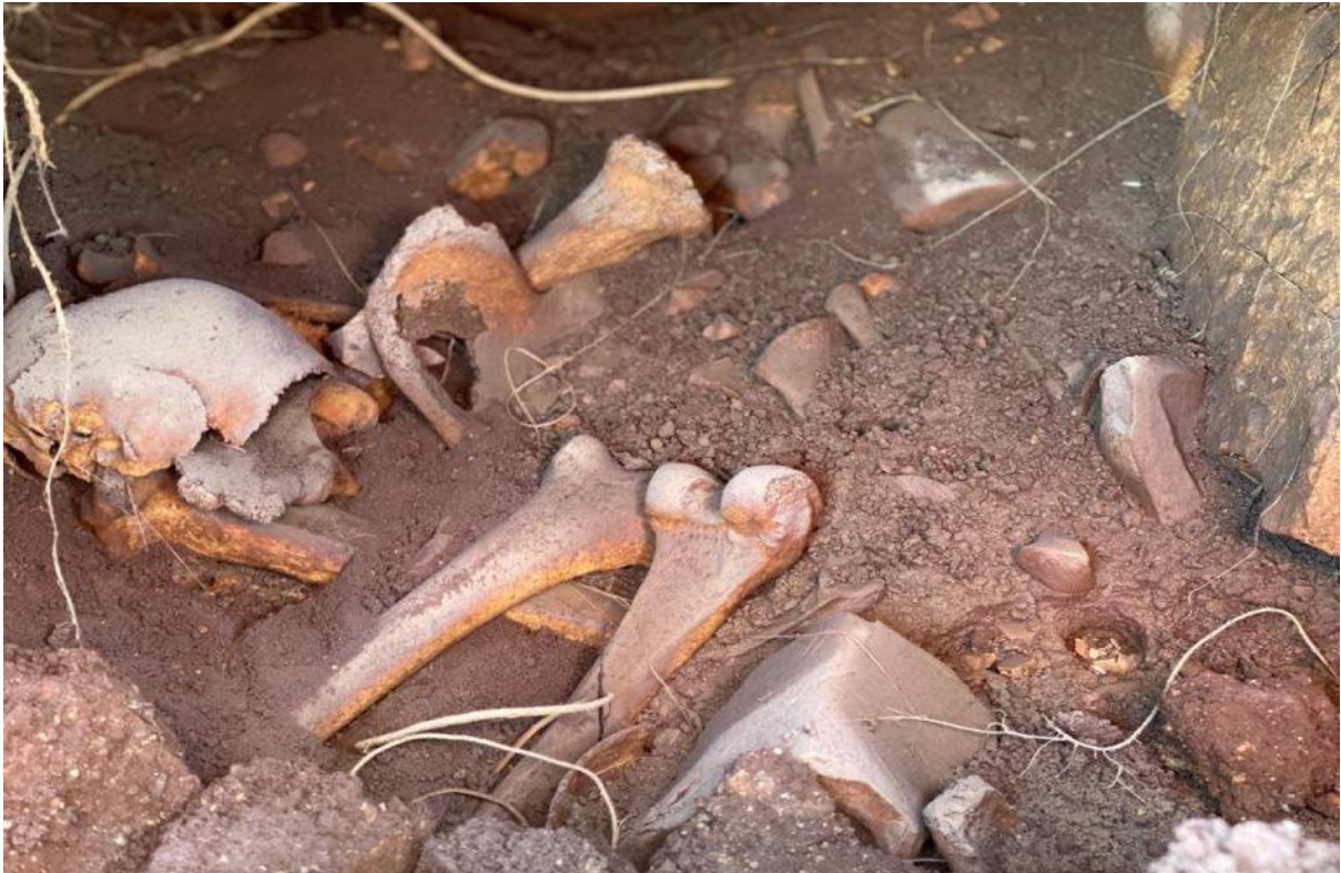
رفات وعظام الأموات في مقبرة صفد بعد عملية الحفر

وتوثق الصور انتهاكات واضحة للمقبرة وتدنيس لحرمة الأموات ونقل رفاتهم وعظامهم.