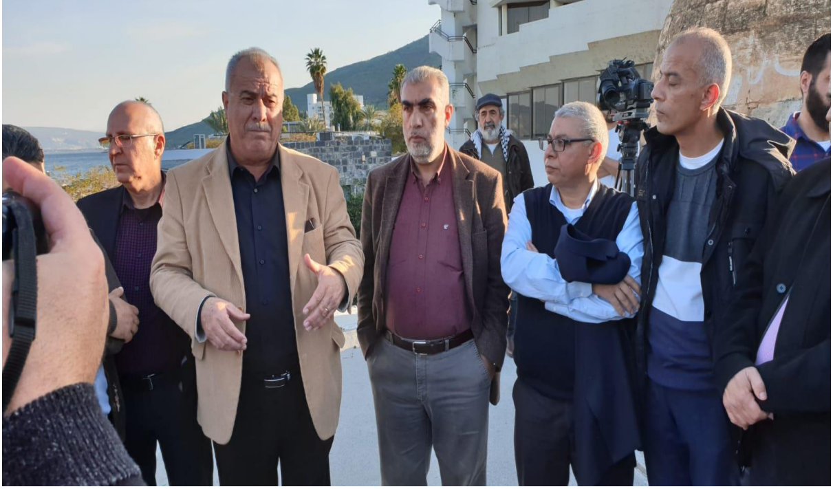
أعضاء من لجنة المتابعة خلال زيارتهم لمسجد البحر

وفي 2019/2/10 توصل وفد لجنة المتابعة العليا للجماهير العربية خلال لقائه مع رئيس بلدية طبريا، إلى اتفاق يحفظ الاتفاق السابق ببقاء وضع المساجد، حسب الوضع القائم في المرحلة الأولى، على أن يتم في المرحلة المقبلة ترميم المسجد.