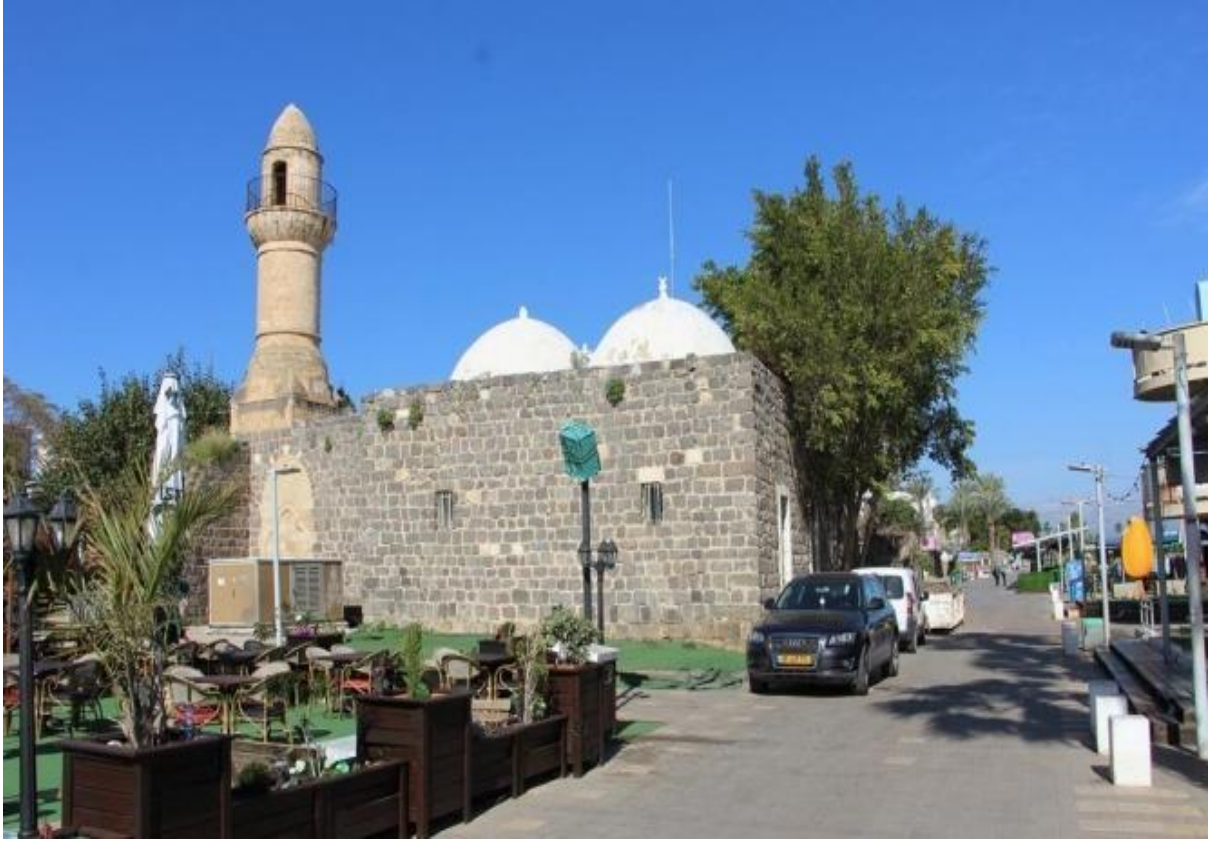
مسجد البحر في طبريا

في مطلع العام 2019، قامت بلدية طبريا بتجريف في ساحة مسجد البحر في طبريا بغية تحويله إلى متحف للآثار القديمة. وقد هبت هيئات وقيادات عربية وشخصيات إسلامية للدفاع عن هذا المسجد، وبعثت مؤسسة ميزان لحقوق الإنسان في مدينة الناصرة، برسالة عاجلة إلى رئيس بلدية طبريا وطالبته بالوقف الفوري لأي عمل في مسجد البحر وإخراج جميع المعدات والآليات، خلال مدة أقصاها 48 ساعة، للرد على الرسالة والاستجابة للمطالب، قبيل التوجه إلى القضاء لاستصدار أمر فوري بوقف الأعمال.