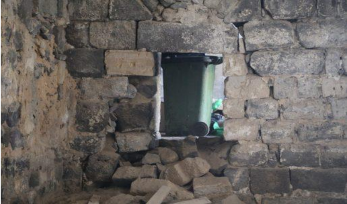
أعمال جرف داخل مسجد البحر في طبريا