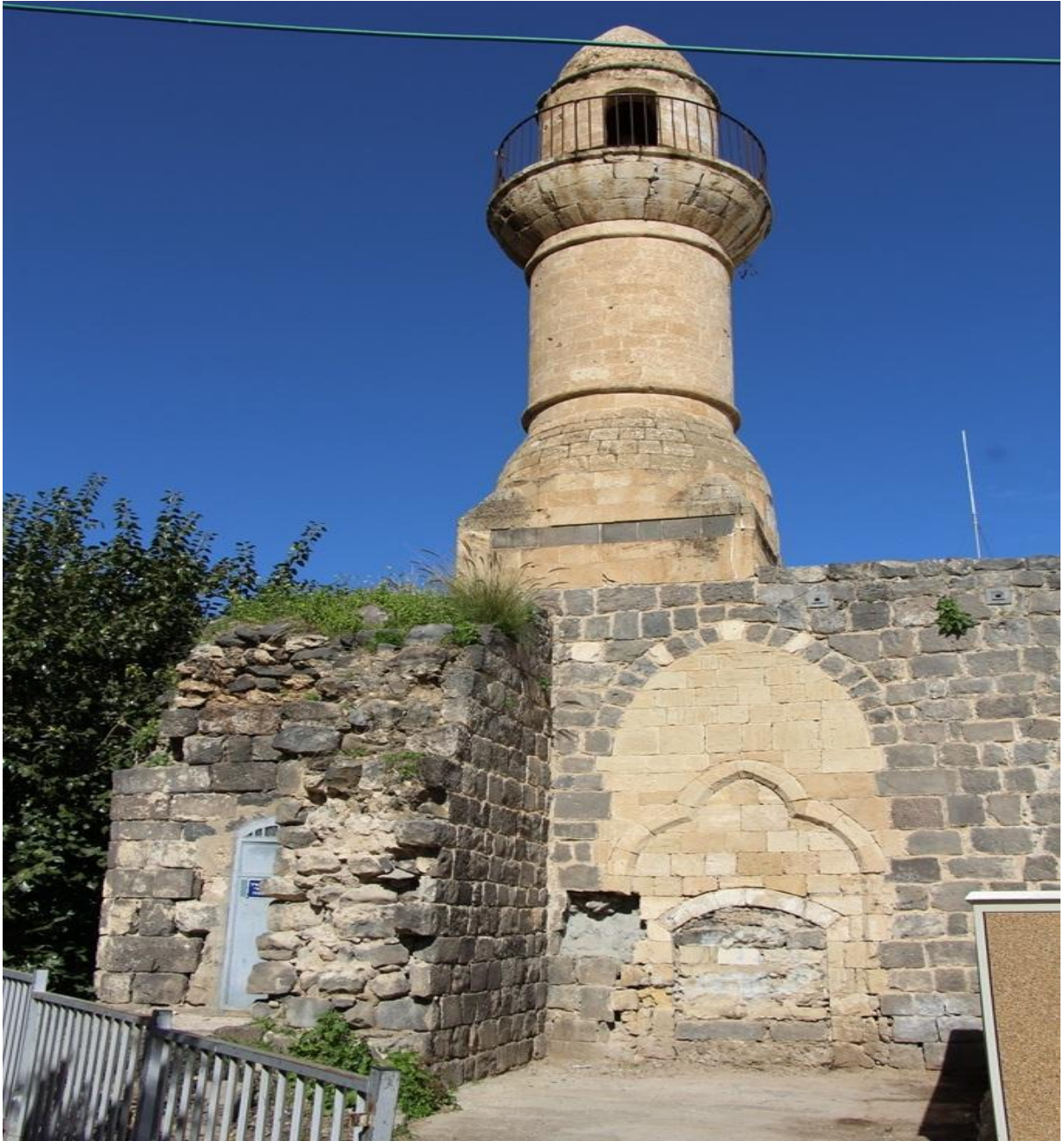
منذنة مسجد البحر في طبريا