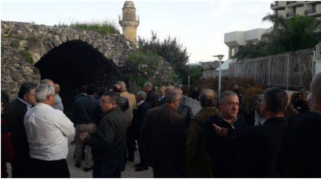
هينات وشخصيات شعبية تهب للدفاع عن مسجد البحر 2019/2/5

وبين المحامي عمر خميسي أن بلدية طبريا تعمدت إغلاق المقدسات والمساجد والمقابر أمام العرب ومنعت إقامة الصلوات بالمسجدين وكانت تلاحق قضائيا كل من يحاول القيام بأعمال الصيانة والترميم، مثلما حصل مع "مؤسسة الأقصى"، التي رفضت طلباتها لصيانة المقابر والمساجد والمقبرة المسيحية ولوحق أعضاء الجمعية والمتطوعون قضائيا بهدف إبعاد العرب عن المقدسات وتركها لتكون عرضة للسقوط والانهيار، ومن ثم وضع اليد عليها واستخدامها للأهداف التهويدية والإسرائيلية.