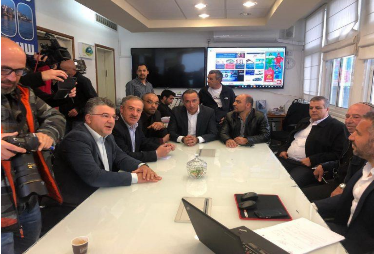
جلسة وفد لجنة المتابعة مع رئيس بلدية طبريا

وأضاف أن وفد المتابعة شدّد في الجلسة على أن المسجد فقط يستعمل للصلاة وليس لأي غرض آخر لأن من شأن ذلك أن يستفز المسلمين ويؤجج مشاعرهم لما فيه من انتهاك ديني لهم، وقال: هذا خط أحمر لا يمكن التنازل عنه وكنا نتوقع من بلدية طبريا أن تقوم بترميم المساجد والمحافظة عليها كمباني إسلامية وليس تحويلها كمتحف أو أي غرض آخر.