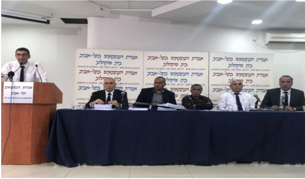
(مؤتمر صحفي لعائلة الدوابشة ومؤسسة ميزان في تل أبيب- 2017/5/8)

وأصدرت العائلة ومؤسسة ميزان الحقوقية، التي تمثل العائلة في كل المسار القضائي، بياناً لوسائل الإعلام، دعت فيه إلى المشاركة في المؤتمر الصحفي الذي تعقده بتل أبيب لعرض تفاصيل الدعوى والإجابة على أسئلة الصحفيين.