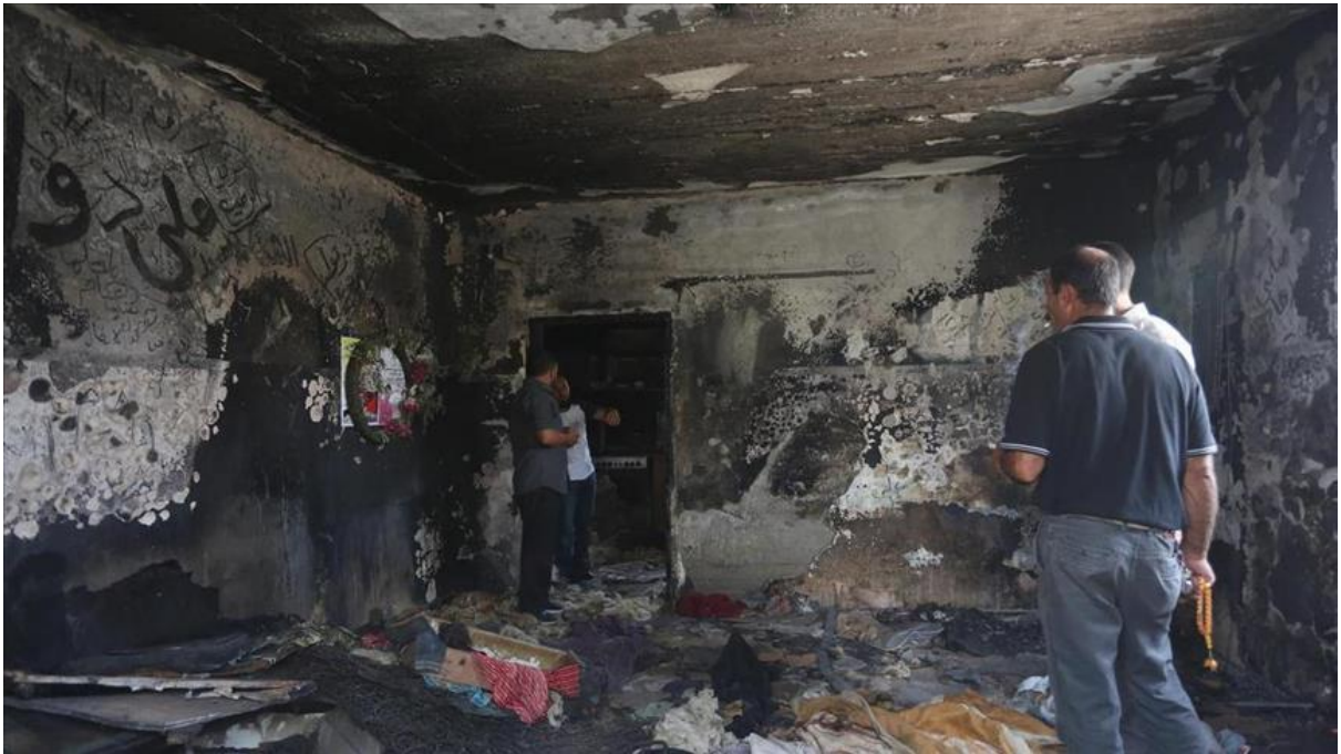
(بيت الشاهد الوحيد بعد حرقه فجر يوم 20/3/2016)