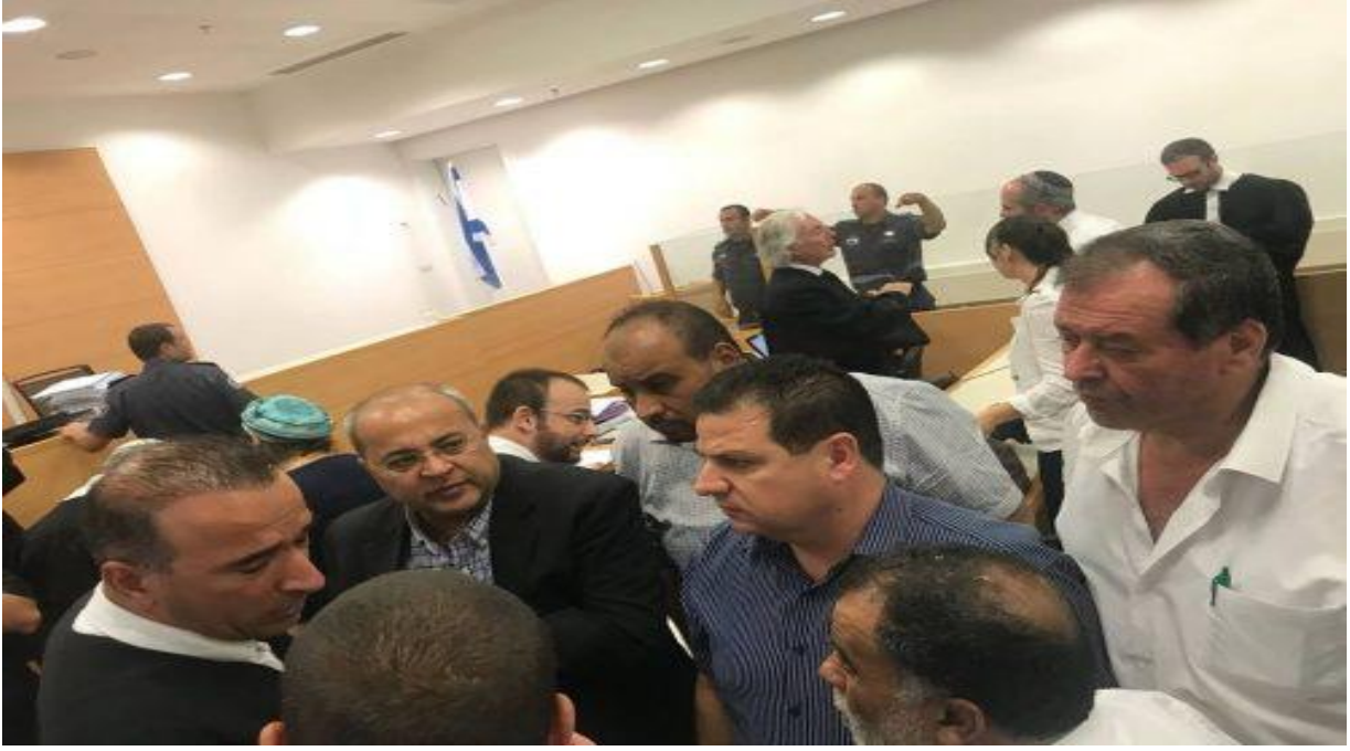
(من جلسة المحكمة المركزية في اللد- 2018/6/19)