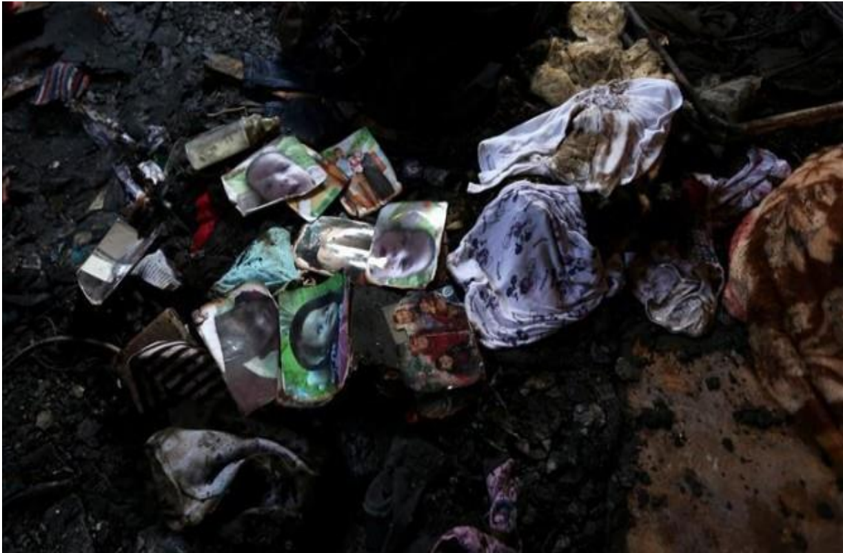
(أثار المحرقة في دوما- 2015)

وخلال المداولات بالمحكمة، اعتبرت النيابة أن الجريمة نفذها شخص واحد، والمتهم الثاني "ساعد عن بعد"، فقد وجهت المحكمة للمتهم الرئيسي تهمة قتل 3 فلسطينيين في حين وجهت تهم التخطيط والمساعدة في القتل للمتهم الثاني.