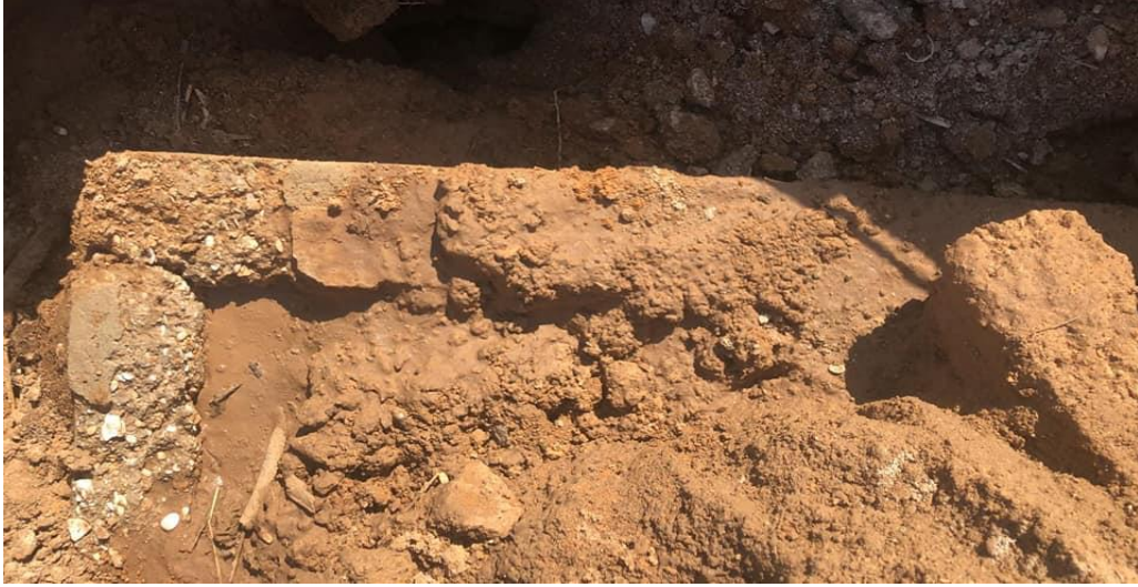
(عظام لموتى مسلمين مدفونين في مقبرة الزرنوقة)