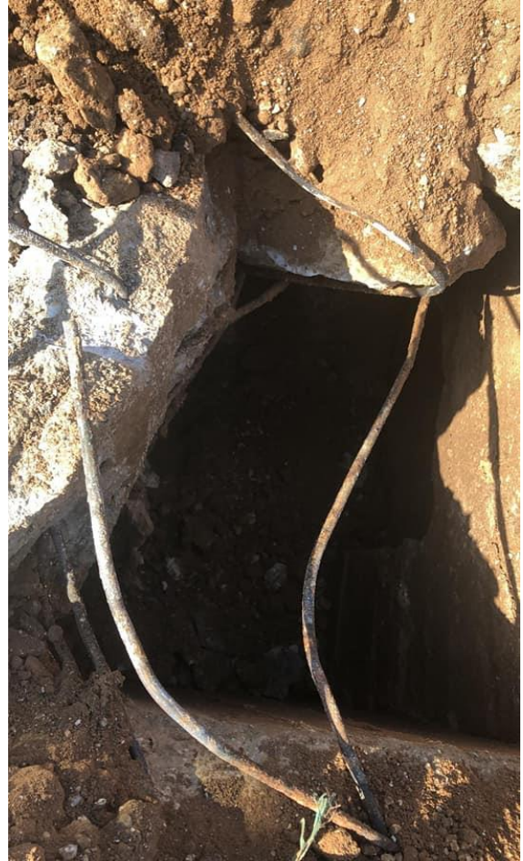
(قبور لمدفونين في مقبرة الزرنوقة الإسلامية)