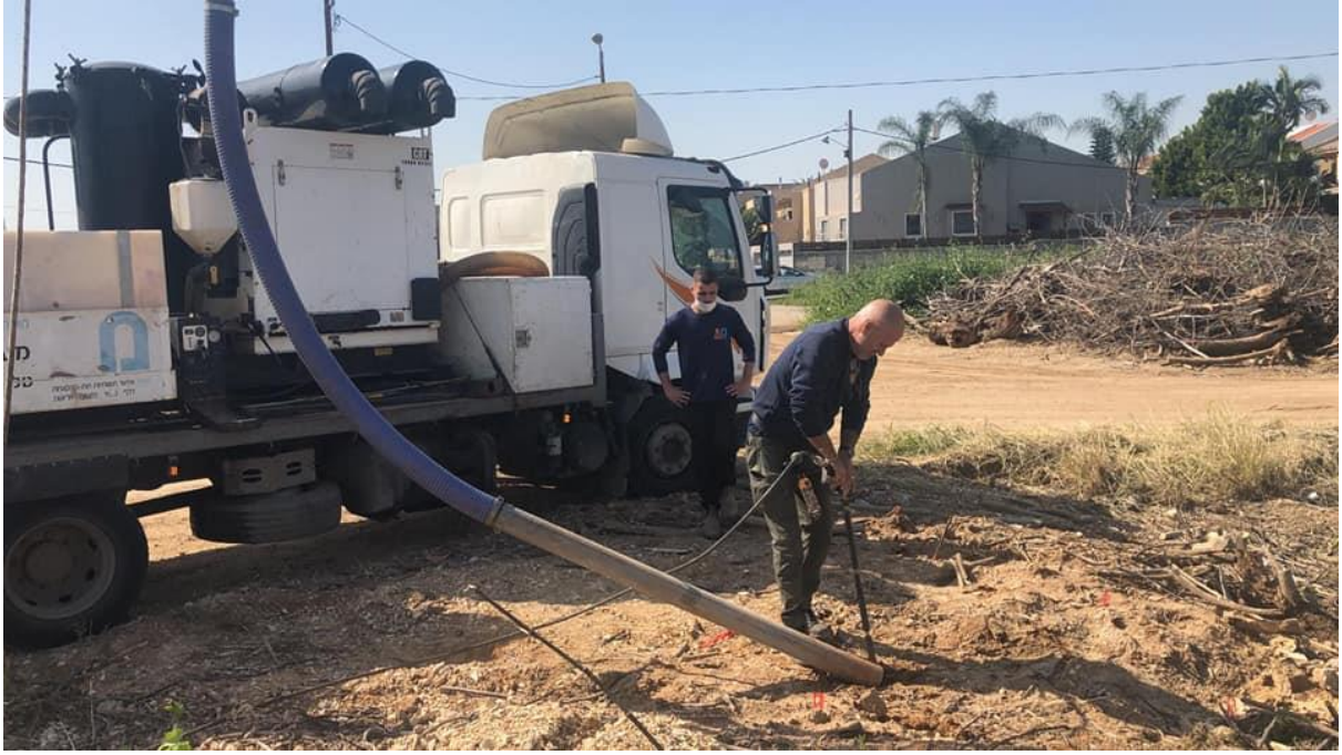
(أثناء عملية البحث عن القبور في مقبرة الزرنوقة)