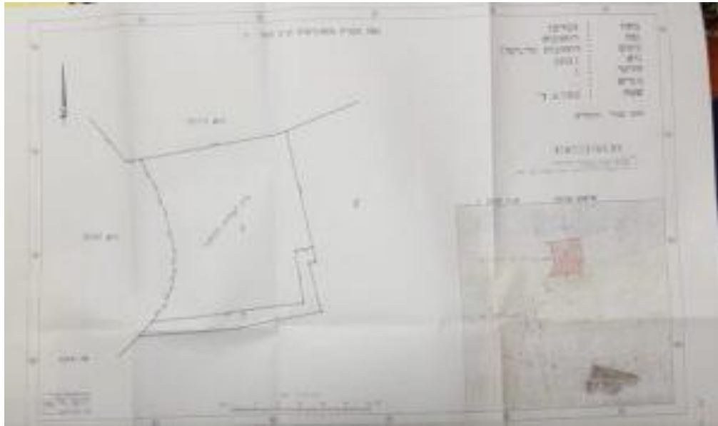
(خريطة هندسية تبين مكان المقبرة في قرية الزرنوقة)

ففي شهر شباط/فبراير 2019، تعرضت أرض مقبرة "الزرنوقة" قضاء الرملة لانتهاك من قبل بلدية "رحوفوت" ولجنة التخطيط والبناء وما يسمى "دائرة أراضي إسرائيل" لتحويل جزء من أرض المقبرة إلى قطعة لإنشاء مباني سكنية عليها.