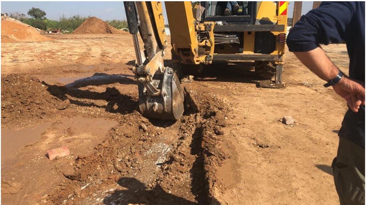
(أثناء عملية البحث عن القبور في مقبرة الزرنوقة)