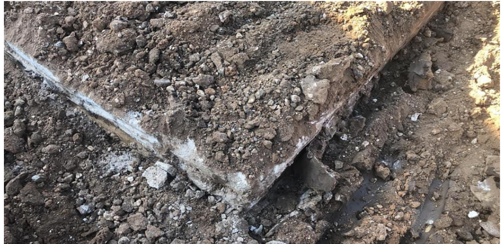
(قبور لمدفونين في مقبرة الزرنوقة الإسلامية)