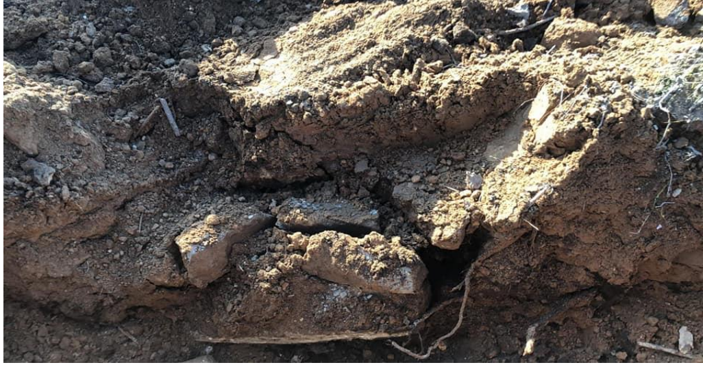
(قبور لمدفونين في مقبرة الزرنوقة الإسلامية)